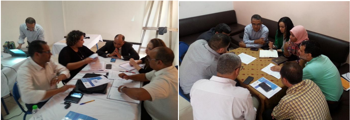
صور لإحدى الورشات التكوينية حول القانون التنظيمي لقانون المالية

وبالإضافة إلى الإطار النظري الذي جاء به القانون التنظيمي 13-30، فقد تم عرض مشروع جدول النجاعة الخاص بالوزارة برسم سنة 2017 وكذا مشروع النجاعة الخاص بوزارة الفلاحة والصيد البحري برسم سنة 2016 على سبيل المقارنة. كما تم تنظيم عدة ورشات تطبيقية همت كيفية صياغة البرامج والأهداف وكذا ورشة حول مؤشرات الأداء المرتبطة بمجالات تدخل الوزارة (الشباب والرياضة والطفولة والمرأة).