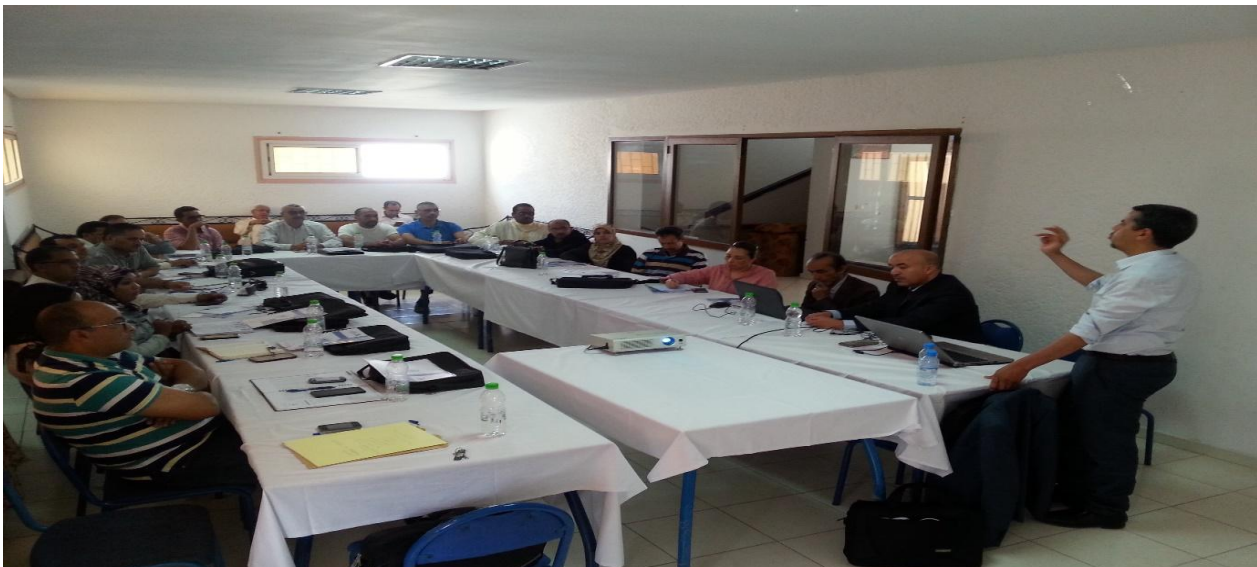
مجموعة من الصور الخاصة بهذه الدورة التكوينية